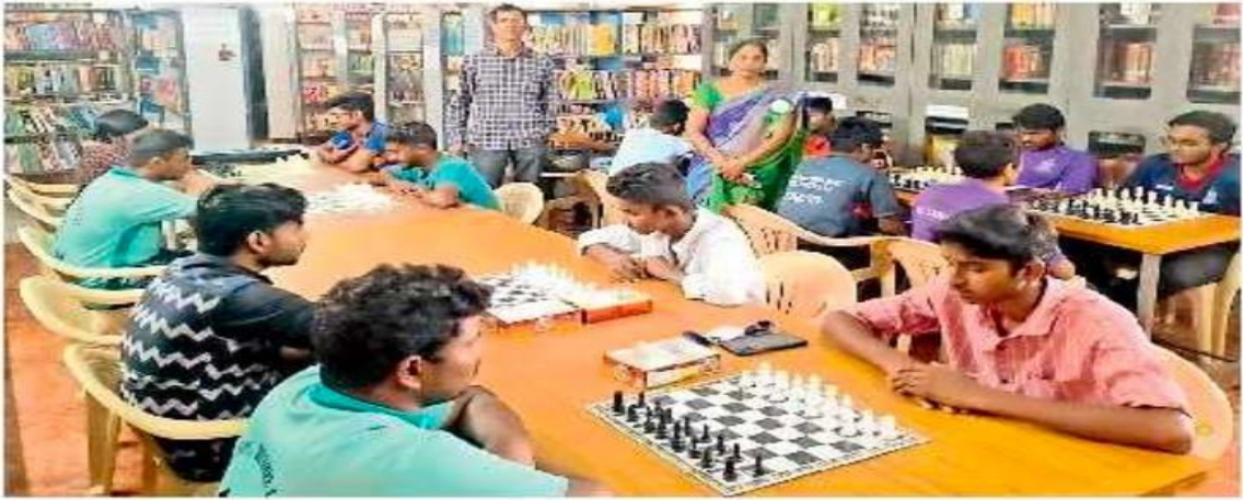
చెస్ ఆడుతున్న విద్యార్థులు