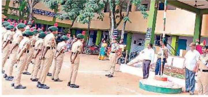
ప్రదర్శనలో పాల్గొన్న విద్యార్థులు